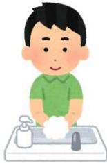
Lavar as Maos