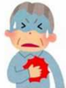
DOLOR EN EL PECHO