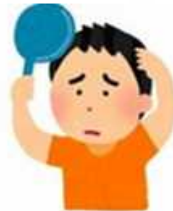
CAÍDA DE CABELLOS